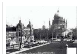
Zerstört. Die ehemalige Potsdamer Synagoge am Platz der Einheit (zwischen Hauptpost und Bürgerhäusern).